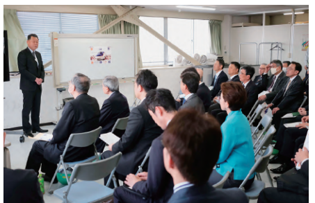
佐々木山形統括センター所長よりご挨拶